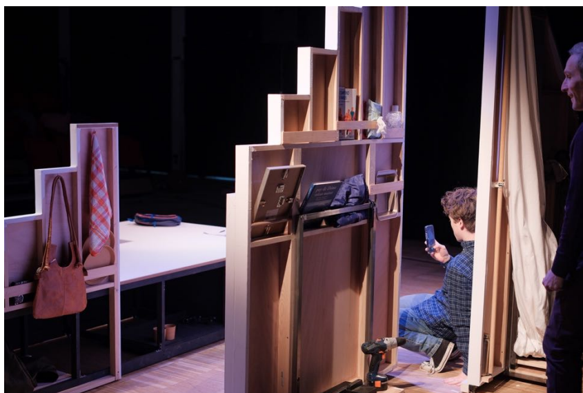
l'envers du décor